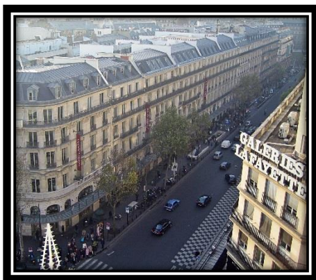
Le boulevard Haussmann

On reconnaît facilement ce style : Il y a toujours de longs balcons au 2 ème et au 5 ème étage. Les façades des immeubles sont aussi très décorées au 2 ème étage car c'était à cet étage que les personnes les plus riches habitaient.