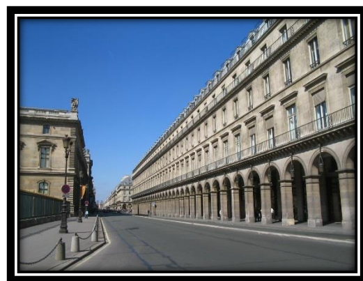
La rue de Rivoli