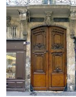
X une porte qui s'ouvre