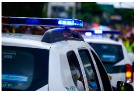
une sirène de police