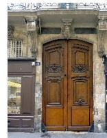
une porte qui s'ouvre