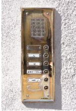
X une sonnette