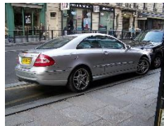
une voiture qui passe