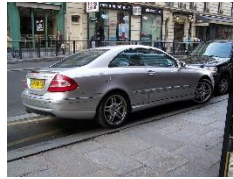
X une voiture qui passe