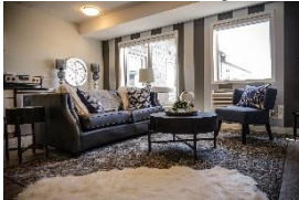
X un salon