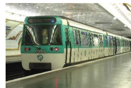
le métro qui arrive