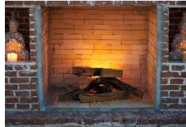
X une cheminée