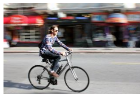
un cycliste qui passe