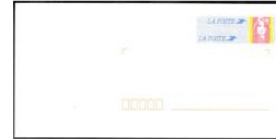
une enveloppe timbrée