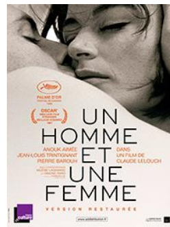
Un homme et une femme de Claude Lelouch