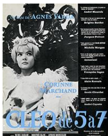
Cléo de 5 à 7 d'Agnès Varda