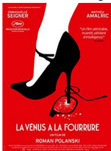
La vénus à la fourrure de Roman Polanski

Quels sont les grands films de la Nouvelle Vague ?