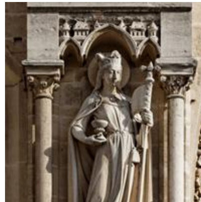
e) le portail la statue