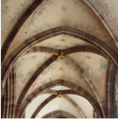
a) la voûte le portail

La cathédrale : à quelle partie correspond chaque image ?