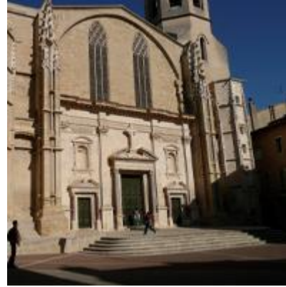
d) la flèche le parvis