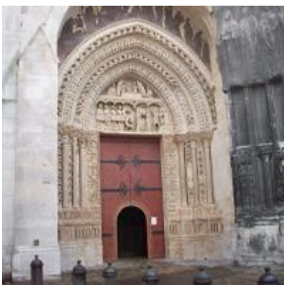
c) la statue le portail