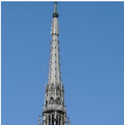
b) la flèche la façade