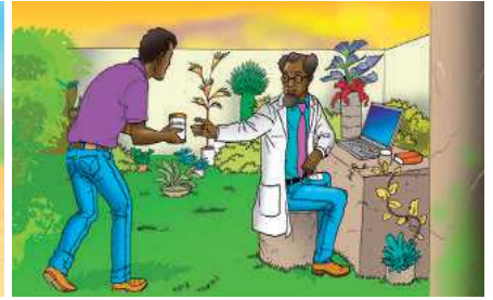
(donner une graine)