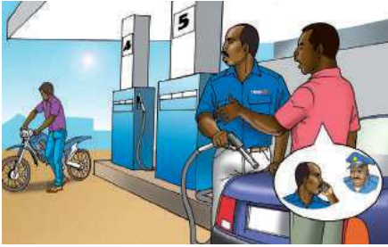
(téléphoner à la police)