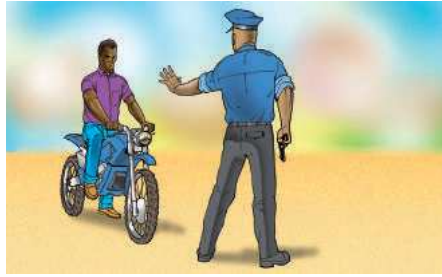
(arrêter la moto)