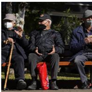
Grèce : fin de l'obligation du port du masque