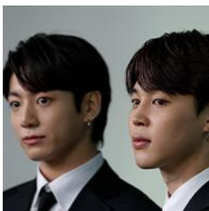
Les stars de la K-Pop BTS à la Maison Blanche