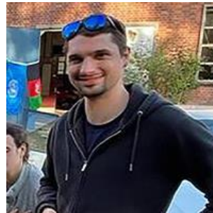
Ukraine : un journaliste français tué près de Sievierodonetsk