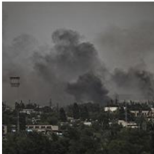
Explosions dans la ville de Sievierodonetsk

2. Quelles sont les 4 images qui correspondent aux 4 titres annoncés ?