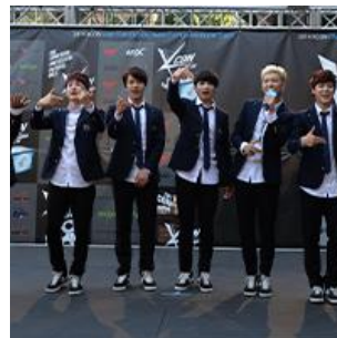
K-Pop : BTS de retour sur scène à Séoul